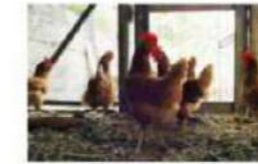
Karina beh (kippen)

uit het woordenboek van Arowaka en Arhwaka Lokonong djang