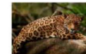
Arwha of Kabadaro (jaguar)