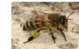
Maba ojo (honingbij)