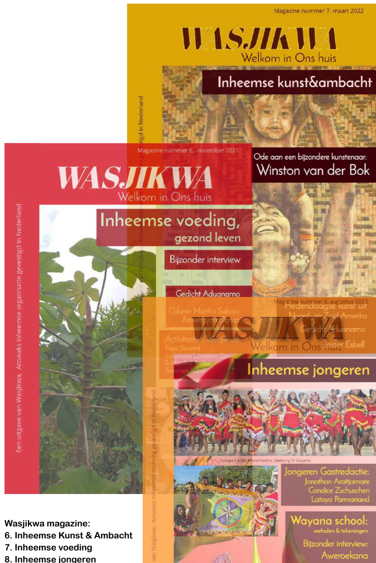
Wasjikwa magazine: 6. Inheemse Kunst & Ambacht 7. Inheemse voeding 8. Inheemse jongeren