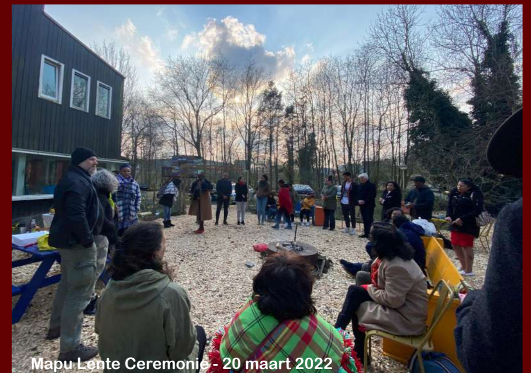
Mapu Lente Ceremonie - 20 maart 2022