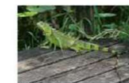
Jowāna (groene leguaan)