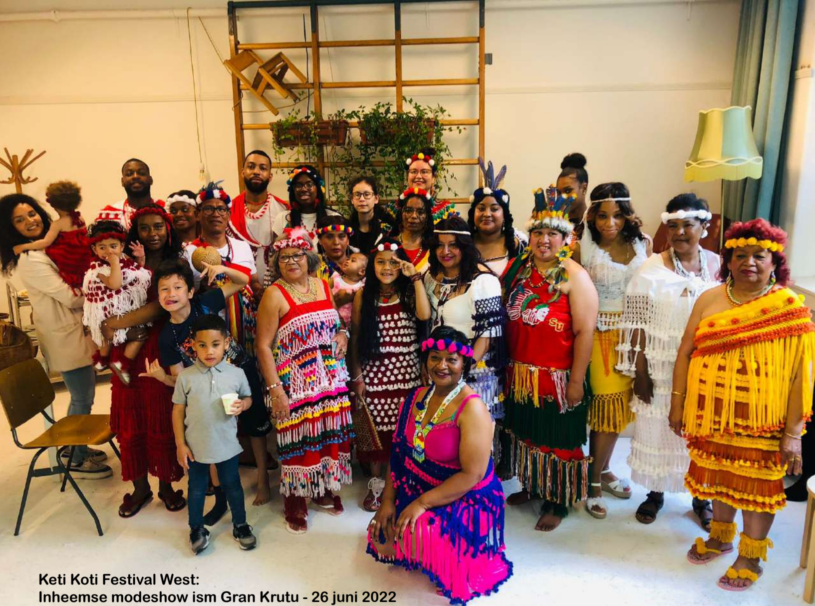
Keti Koti Festival West: Inheemse modeshow ism Gran Krutu - 26 juni 2022