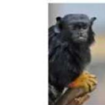
Sèrhèrhè (Tamarin aap)