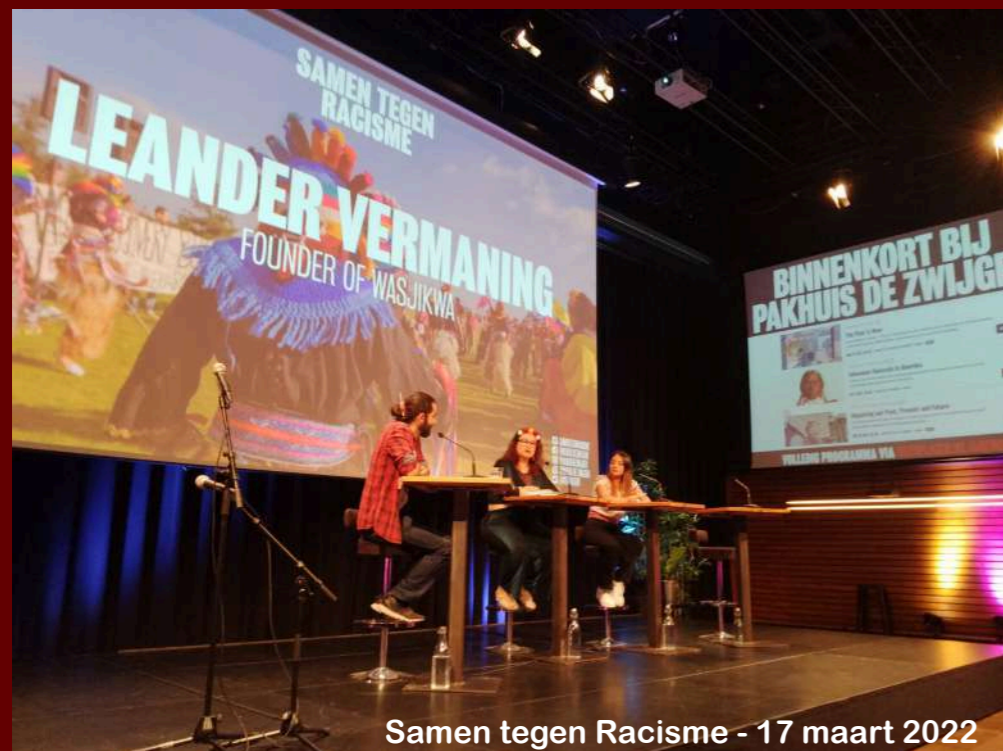
Samen tegen Racisme - 17 maart 2022