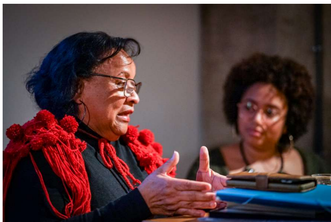
Indigenous Liberation Festival - 12 oktober 2022: Workshop Inheemse identiteit, Solidariteitsmars & 1492 Peoples Tribunal