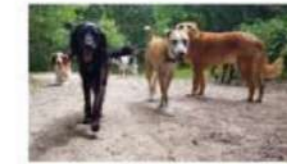
Pèro be (honden)