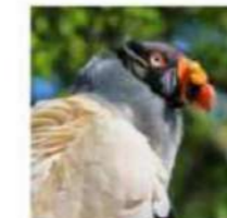
Anwana Arhokong (koningsgier)