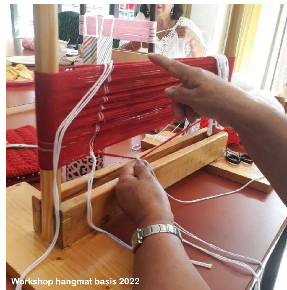
Workshop hangmat basis 2022

Ik kom voort uit een goede afkomst en ik heb een eigen grote waardevolle cultuur die ik heb meegekregen. Daar ben ik trots op. Nu houd ik mij bezig met mijzelf, dat is wat elk mens zou moeten doen. Stilstaan bij wat jou leven waardig maakt. Er is zoveel te ontdekken en nog zoveel te leren. Actief blijven en zo nu en dan even naar binnen kijken wat zo mooi is in jezelf! Nu mag ik samen met mijn oudste dochter mijn cultuur uitdragen aan mijn mensen, mooier kan het niet. Wasjikwa: ik ben eindelijk in mijn eigen ik (huis) aangekomen!!!!