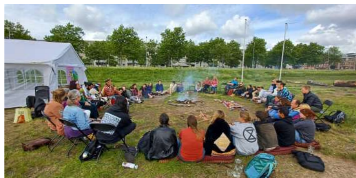
Mapu ceremonie: Xrebellion Jongeren