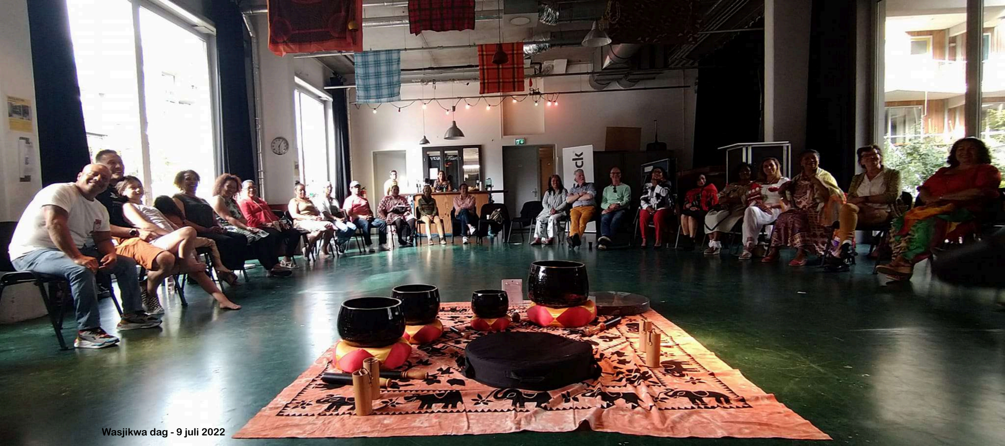
Wasjikwa dag - 9 juli 2022